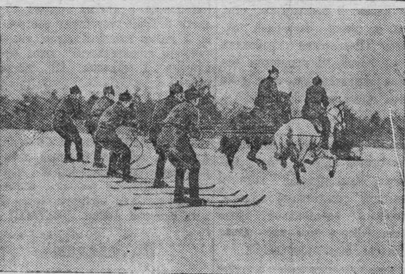
К XXI-й годовщине Красной Армии и Военно-Морского Флота. На снимке: Бойцы Н-ской части (Киевский особый военный округ) на лыжной прогулке.