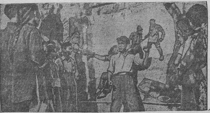
К военным действиям в Китае. Китайский народ мобилизует все силы на борьбу против японских захватчиков. Активное участие в борьбе принимает интеллигенция. Художники пишут на стенах доков картины, призывающие население к защите родины. На снимке: Художник и написанной им картины рассказывает населению о зверствах японских агрессоров.